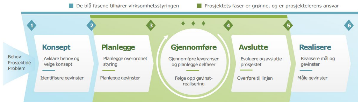
Figur 1: Faseinndeling